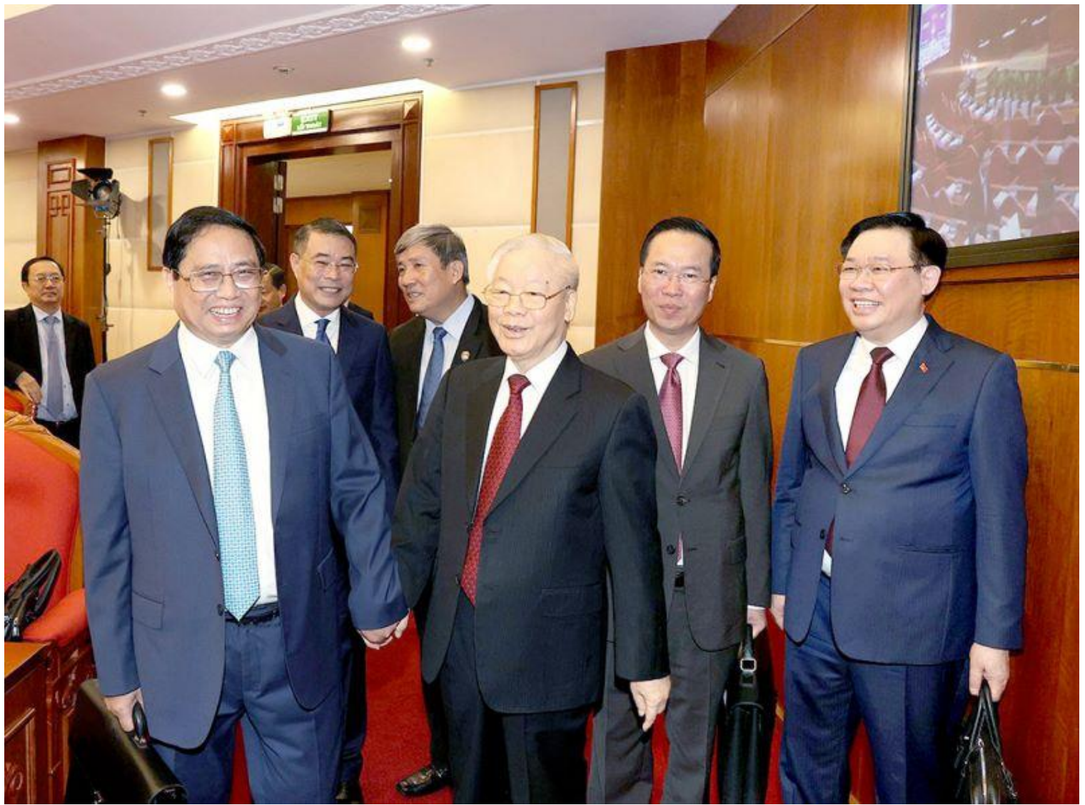
Ảnh: “Tam mã” tranh ghế Tổng bí thư đang theo sát Nguyễn Phú Trọng.

Theo một số nguồn tin mà chúng tôi có được, tại Hội nghị Trung ương 8, Nguyễn Phú Trọng cho rằng, ông ta “không tham vọng quyền lực” và nói rõ sẽ rút lui. Cuộc đua vào ghế Tổng bí thư đảng cộng sản Việt Nam vào năm 2026 chỉ gói gọn trong “cỗ xe tam mã”: Phạm Minh Chính, Vương Đình Huệ và Võ Văn Thưởng.