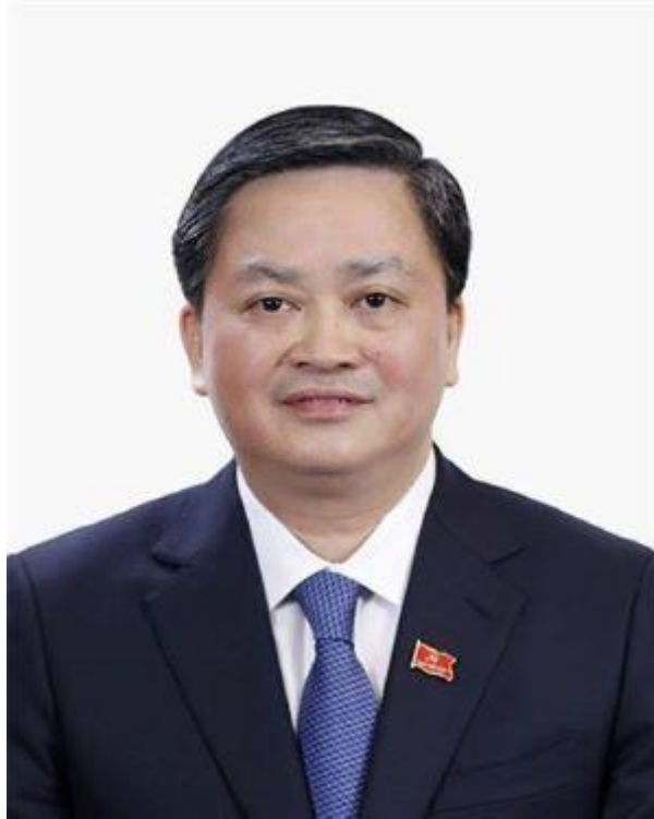
“Đê té thần” Lê Đức Thọ.

Dự đoán Lê Đức Thọ sẽ bị cách tất cả các chức vụ trong đảng và về nhà “ngồi chơi xơi nước” để tiêu tiền.