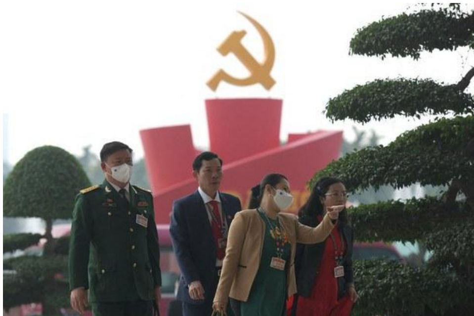
Ảnh minh họa chụp tại Hà Nội trước đây.

Vào ngày 4/11/2018, Tổng Bí thư, Chủ tịch nước Nguyễn Phú Trọng khi chủ trì buổi họp công bố quyết định về việc thành lập Ban chỉ đạo xây dựng quy hoạch cán bộ cấp chiến lược nhiệm kỳ 2021-2026... cũng đã khẳng định: “Dứt khoát không đưa vào quy hoạch những người có biểu hiện suy thoái, biến chất, rơi vào ‘tự diễn biến’, ‘tự chuyển hóa’; nhất là những người cơ hội chính trị, như con lươn, con chạch, luồn lách rất khéo... nên phải thận trọng. Do đó, quá trình quy hoạch phải làm chủ động và phải thường xuyên theo dõi, giám sát liên tục, khi phát hiện cán bộ có vấn đề là đưa ra khỏi quy hoạch ngay...”