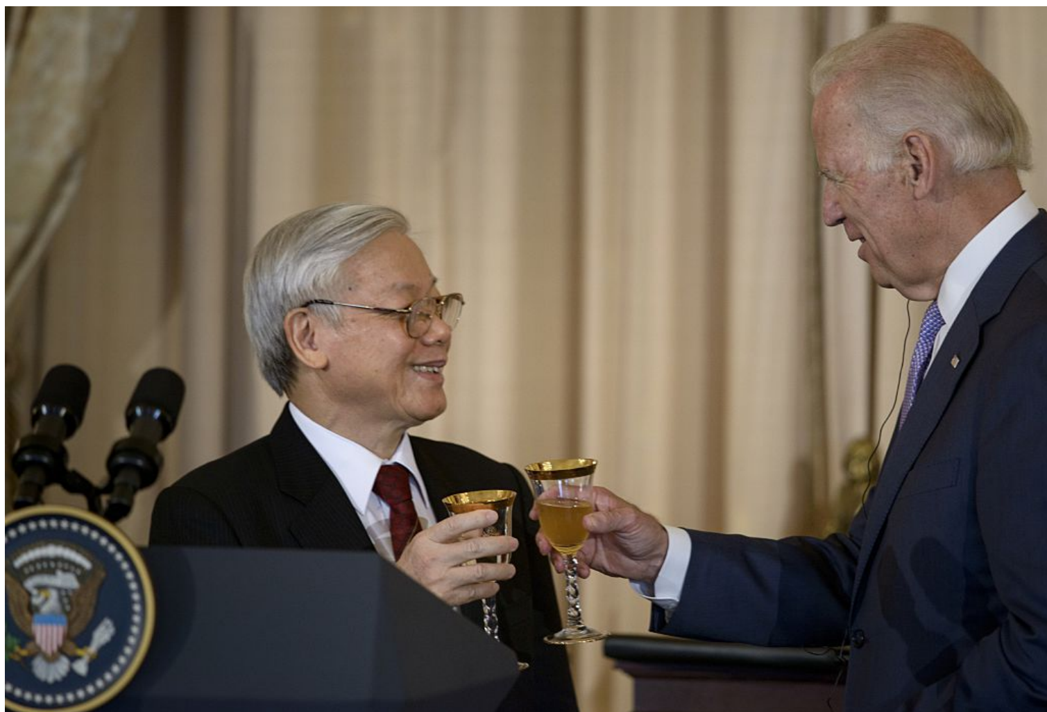
Chú thích hình ảnh Tổng bí thư Nguyễn Phú Trọng gặp gỡ Tổng thống Joe Biden hồi tháng

Tổng Bí thư Đảng Cộng sản Việt Nam Nguyễn Phú Trọng và Tổng thống Hoa Kỳ Joe Biden điện đàm "nhất trí thúc đẩy, phát triển và làm sâu sắc hơn quan hệ song phương"