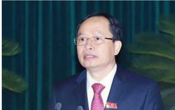
Trịnh Văn Chiến.

Kết thúc Hội nghị Trung ương 8 khóa 13, các “đồng chí” sẽ nghỉ ngơi ít ngày để “diễn kịch” tiếp tại quốc hội. Kỳ họp thứ 6, Quốc hội khóa 15 sẽ khai mạc vào ngày 23-10 và dự kiến bế mạc vào ngày 29-11- 2023. Kỳ họp chia làm 2 đợt, đợt 1 từ ngày 23-10 đến ngày 10-11; đợt 2 từ ngày 20-11 đến ngày 29-11-2023.